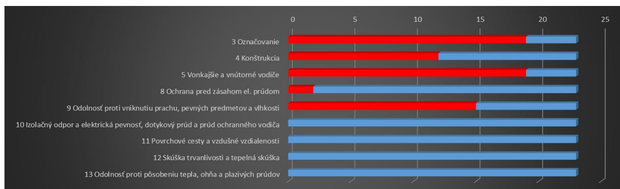
Graf č. 2 – Výsledky skúšok podľa harmonizovanej normy STN EN 60598-1 v spojení s STN EN 60598-2-20